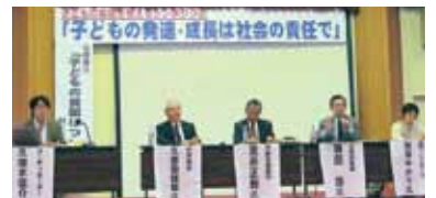
党県議団も加わる反貧困ネットワーク信州が開いたシンポジウム(9月23日・松本市)

「子どもの貧困が7人に1人と広がる中、就学援助制度の周知徹底や市町村格差の是正、子どもの医療費の窓口無料化を県として実施を」と求めました。知事は「本来、国が行うべきもの。国に対して強く要望していきたい」としながらも、貧困問題について「県として十分認識して取組んでいかなければいけない」と答えました。