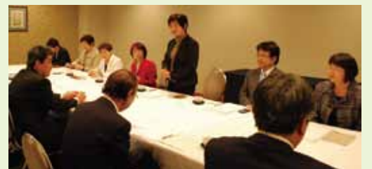
県歯科医師会との懇談