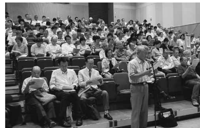
「浅川の治水対策に関してご意見をお聞きする会」(9月15日)