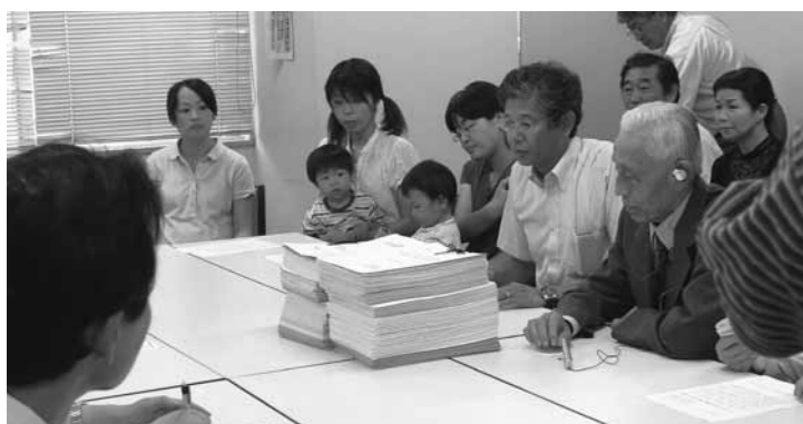
福祉医療費の窓口無料化を求めて署名簿を提出する福祉医療給付制度の改善を進める会の皆さん。(7月20日)

全国の同時期に設立された公立短大のほとんどは4年制に移行していること、短大では取得しにくい資格があること、大学進学希望者の8割が県外に流出していることなど現状を指摘。また、家計を心配して進学をあきらめざるをえないなど、高校生に置かれた事態は切実です。知事自らが現場に足を運び関係者の声によく耳を傾けるよう提案し、知事も「できるだけ早期に現場に伺う」と答え、10月19日に学長と懇談しました。