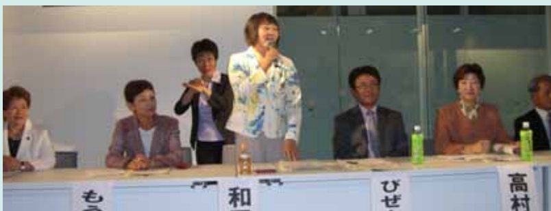
塩尻会場で（9月25日） 手話通訳士の協力もいただいて……